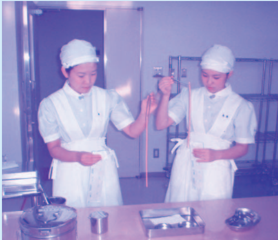
学内での技術演習風景 - 滅菌操作の練習 -