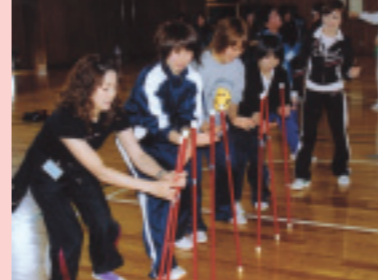
協調性や自主性を育むため4月27-28日 県立焼津青少年の家で開催されました。