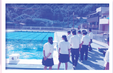
●インターンシップの消防学校見学