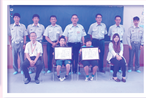
●救急活動協力者の表彰式