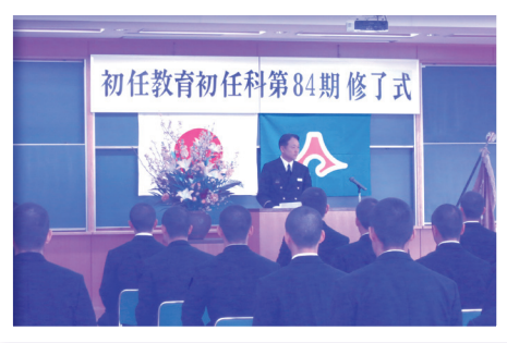
●消防学校初任科修了式