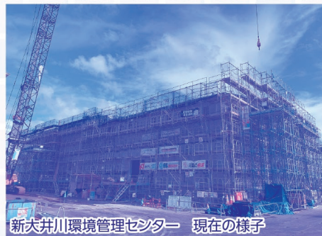
新大井川環境管理センター 現在の様子