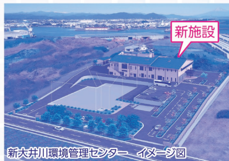
新大井川環境管理センター イメージ図