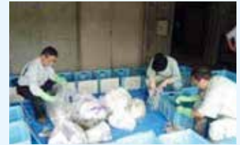
ごみ組成分析の作業の様子

燃やすごみの袋の中身の調査で、どのようなごみが、どれくらいの割合で入っているかを計測します。これにより、燃やすごみが適正に出されているか、資源化可能なごみがどの程度入っているかなどがわかります。この調査で得られた結果は、ごみ減量化やリサイクル事業推進のための資料として使われます。