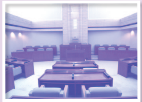
●志太広域事務組合議場です 議会では大事なことを決定します

総務課の仕事は、一般的な会社と同じようにその他の部署では扱わない事務の多くを扱う部署となっています。志太広域事務組合には議会もあり、その運営も行っています。そのほかに、組合全体の予算編成などの財政事務、消防職員の採用事務、資産管理・職員の労務管理・入札事務・出納事務など表紙ページでご紹介した組合の主要業務を支援する役割を果たしています。この広報志太広域の発行も総務課の業務の1つとなっています。