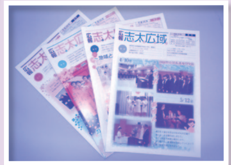
●組合の事業を広報誌で紹介します