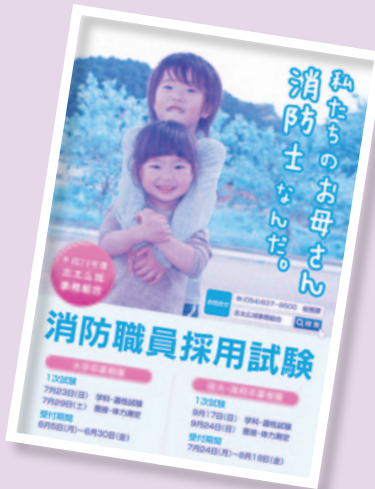
●ポスターで消防職員採用をPR