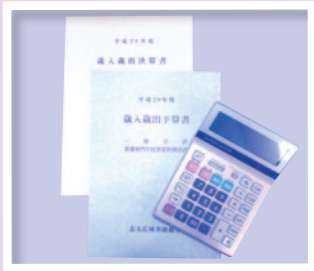
●予算や決算書の作成を行います