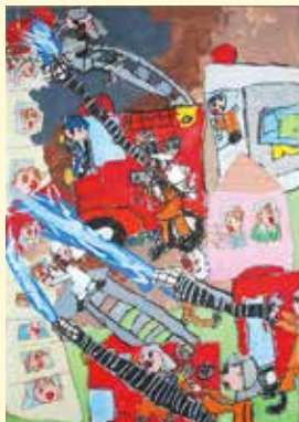
(麓仁美さんの作品)