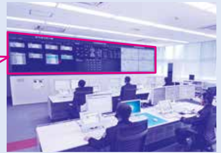
通信指令センター（焼津市石津）

近年、消防を取り巻く環境は、少子高齢化、生活様式の多様化、地球温暖化の影響など予想しがたい災害や事故の発生が危惧されるとともに、地震や集中豪雨などの自然災害が全国各地で発生している状況にあります。