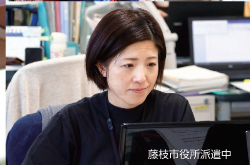
藤枝市役所派遣中

志太消防本部には、現在8名の女性消防士が在籍(1名は消防学校入校中)。女性ならではの視点から、志太消防本部の行う様々な事業を改善・活性化するとともに、焼津・藤枝の住民の安全・安心を守るため、日々の業務に励んでいます。