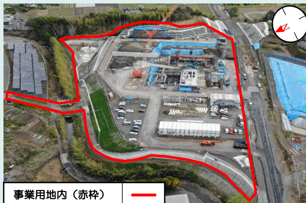
< 令和6年3月末現在 >