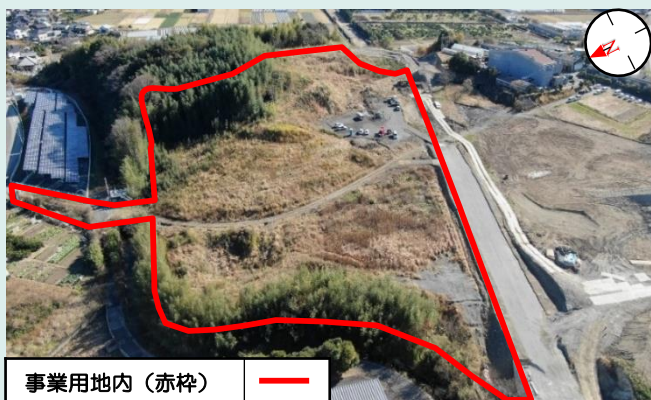
< 令和4年12月末(工事着工前) >