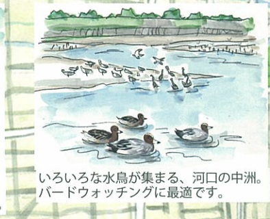
いろいろな水鳥が集まる、河口の中洲。バードウォッチングに最適です。