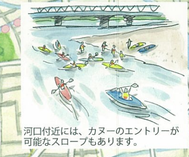
河口付近には、カヌーのエントリーが可能なスロープもあります。