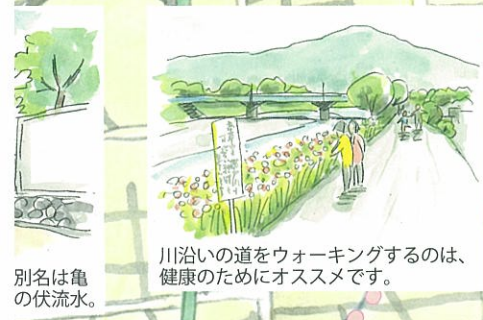
別名は亀の伏流水。 川沿いの道をウォーキングするのは、健康のためにオススメです。