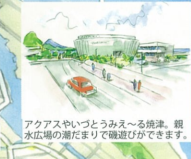
アクアスやいづとうみえ〜る焼津。親水広場の潮だまりで磯遊びができます。