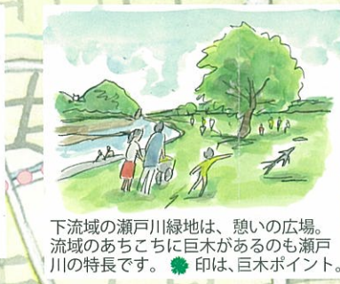
下流域の瀬戸川緑地は、憩いの広場。流域のあちこちに巨木があるのも瀬戸川の特長です。●印は、巨木ポイント。