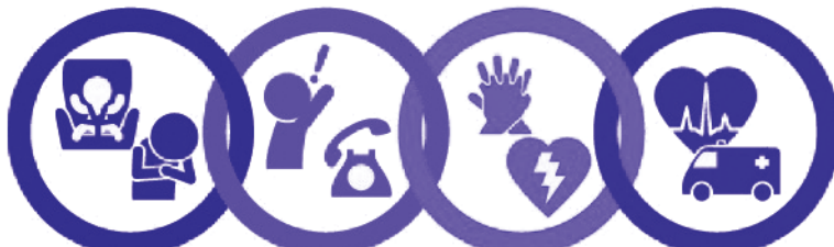
心停止の予防 早期認識と通報 一次救命措置 二次救命措置

救急車が来るまでの間、命を救うためにあなたにしかできないことがあります。 救命講習を受講して応急手当の知識と技術を学んでみませんか？