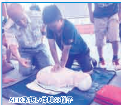
AED取扱い体験の様子

中、消防署が作成したカリキュラムに沿って、消防士に付き添われながら、元気いっぱいに放水体験やAEDの取扱い体験などを含む消防士の仕事を体験しました。